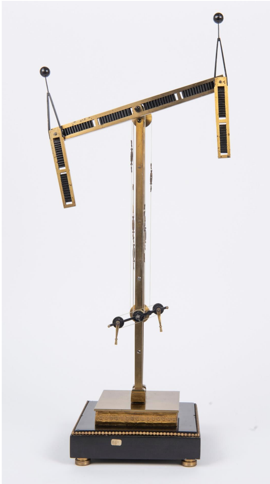
Maquette scientifique du télégraphe optique Chappé, échelle 1/20e, laiton / cuivre / marbre et fils synthétiques, 1943 - Collection Musée de La Poste