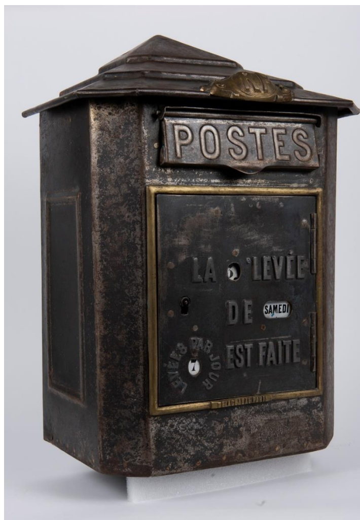
Boîte aux lettres française Delachanal, grand modèle 57x37x26 cm, tôle de fer / alliage cuivreux, 1918 –Collection Musée de La Poste