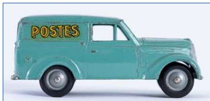
Fourgon des postes Renault Juva 4, C.I.J, zamac, peinture et caoutchouc, 1956, coll. Musée de La Poste - Paris / La Poste