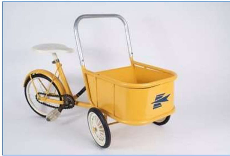
Tricycle à pédales aux couleurs des PTT, Verybest, métal, plastique et caoutchouc, 1960-1970

Le visiteur se laisse emporter dans le monde merveilleux des jouets postaux au gré d'une scénographie immersive et ludique...