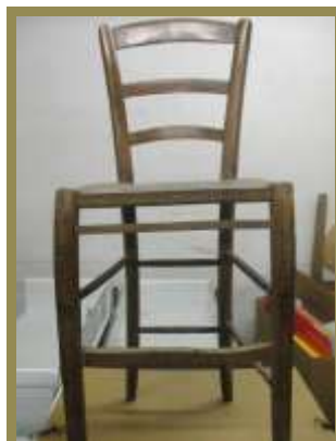
Chaise de standard téléphonique

.../... En partenariat avec l'association La Vie Rurale de la commune de Lempdes sur Alagnon, Les amis de l'histoire des PTT de Haute-Loire exposera entre autre :