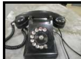
Téléphone Années 30