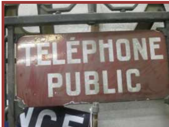
Enseigne téléphone public