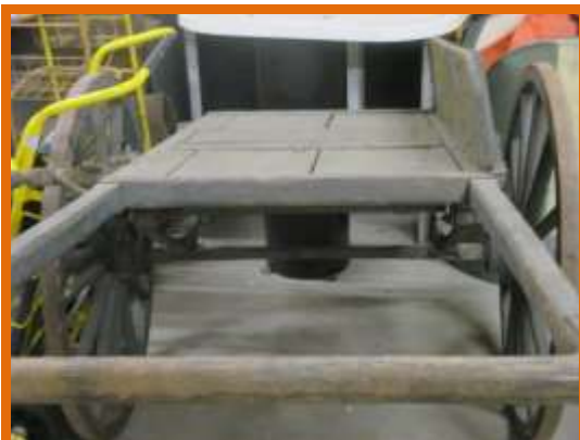
Charette à bras intervention de lignes