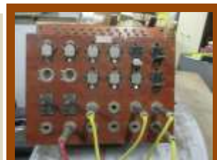
Standard manuel Années 50