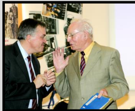
20 e anniversaire de la FNARH, 2004.