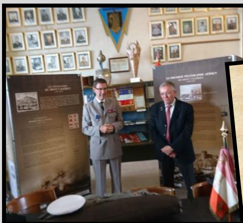
AG de l'UNATRANS, 2017.