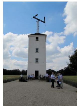
Ph. B. Bentz

> Ligne Paris – Brest (1799) • Tour du Trou d'Enfer de Bailly • L'École de la campagne et de la forêt • Domaine présidentiel • 78160 Marly-le-Roi • Tél. : 01 34 62 14 29 • Courriel : contact@ecole-campagne.net • Sites : www.ecole-campagne.net • www.telegraphe.tde.free.fr •