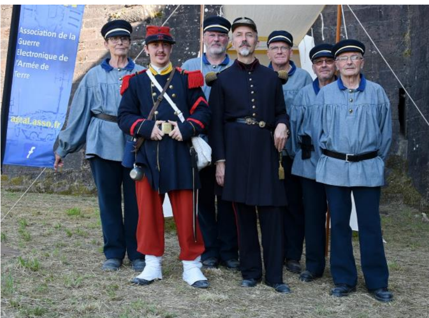
L'équipe de reconstitution.

Cette action méconnue des agents des P et T au service de l'armée peut être considéré comme l'un des éléments principaux de la résistance de Belfort. Cette défense héroïque de la ville (c'est son troisième siège repoussé) a suscité la décision des dirigeants de l'époque de proposer