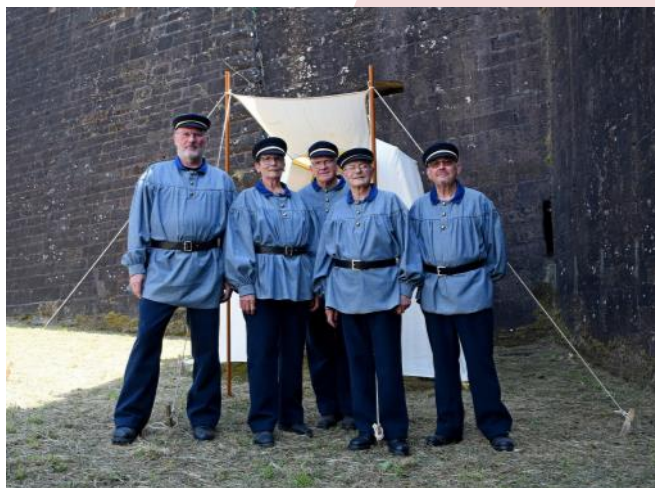
La tente extérieure.

Après de nombreuses réunions préparatoires, le chantier d'aménagement a débuté en février par le nettoyage des locaux, le montage des cloisons, la réalisation du plancher et l'aménagement intérieur du bureau télégraphique. Nous avons poussé le mimétisme jusqu'à recréer les circuits télégraphiques intérieurs dans les couloirs et les escaliers de la citadelle en remettant en place du câblage noir sur de véritables porcelaines isolantes.