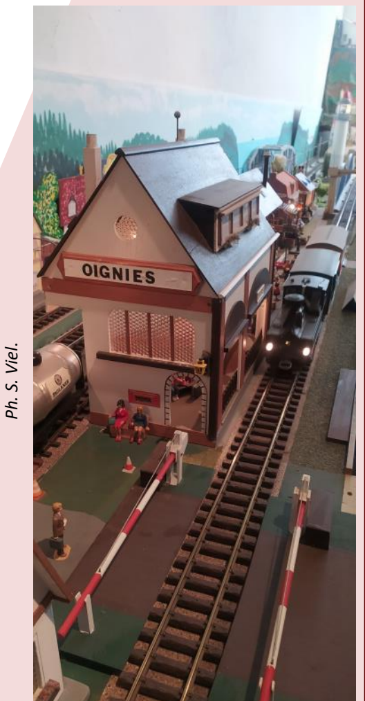
Ph. S. Viel.