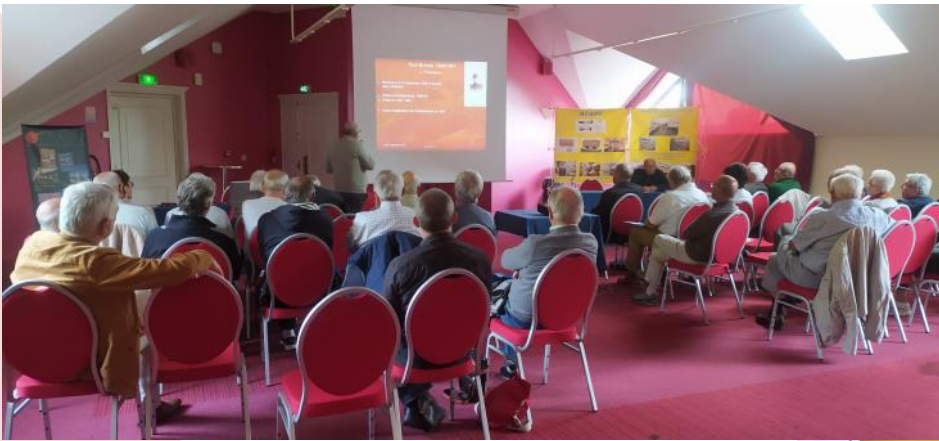
La salle Blériot de Najeti Hôtel du Parc.