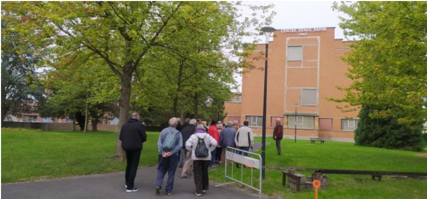
Le Centre Denis Papin.

Après une journée et demie de conférences, la journée du vendredi est consacrée à la visite des trois musées regroupés au Centre Denis Papin à Oignies.