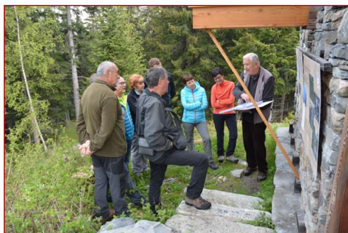
Ph. D. Bénard.