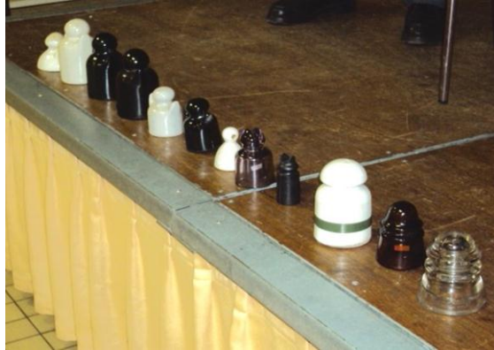
Une partie de la collection d'isolateurs de Jean-Pierre Volatron.

► Contact : Élie Ramon, président • ACAPF • 35 rue de Nomain • 59242 Templeuve • Tél/Fax : 03 20 05 99 74 •