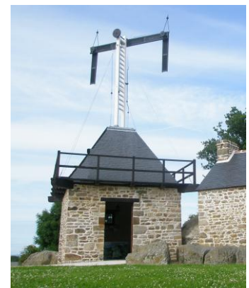
Tour Chappe de Saint-Marc, Baie du Mont-Saint-Michel.