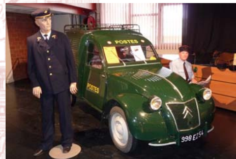
La 2 CV.

Avec un stand de près de 200 m 2 , LORHISTEL a pu montrer les éléments représentatifs de ses collections en rapport avec les objets du quotidien qui sont devenus, petit à petit, des éléments de Patrimoine. Grâce à l'invitation de l'Association Philatélique de Morhange, et au soutien des personnels du centre socioculturel et de la mairie de Morhange, l'association a ainsi pu mettre à l'honneur ses trois véhicules des PTT : la Juva 4, la Renault 4 et la magnifique 2 CV fourgonnette postale de couleur verte.