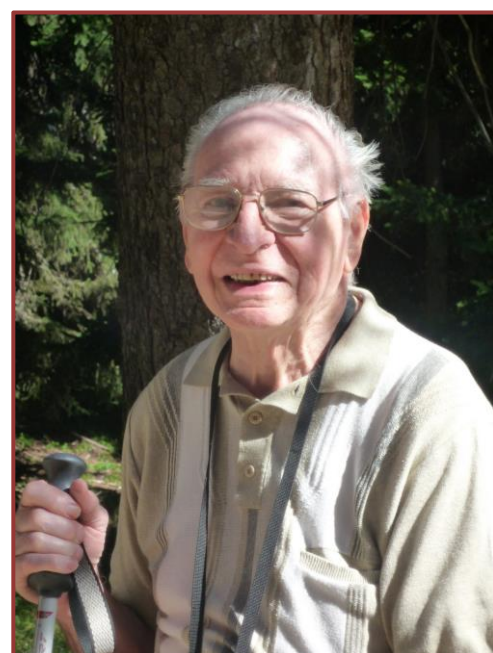
Ph. Harry Franz Michel Ollivier à l'occasion des Journées d'étude Chappe à Aussois en 2010