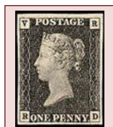
Le premier timbre émis au monde – le 1 er mai 1840 –, le célèbre Black Penny , à l'effigie de la reine Victoria.

Le 40 e Salon philatélique de printemps, du 14 mars 2019, fut l'occasion pour La Poste de fêter le 170 e anniversaire du premier timbre français. Moins d'un siècle après la bataille de Fontenoy, « Messieurs les Anglais » n'attendaient pas que des officiers Français les invitent à « tirer les premiers ». On n'était cependant plus sur un champ de bataille, mais sur le terrain de l'économie, de la modernité. Mieux que des tirs, ce sont des tirages que les sujets de sa gracieuse Majesté s'empressèrent alors de réaliser. Ceux du premier timbre émis au monde, le célèbre Black Penny , à l'effigie de la reine Victoria. C'était le 1 er mai 1840. La France mit quelques années avant de s'y mettre à son tour. Pas moins de neuf. Ce n'est en effet qu'en janvier 1849 que fut émis le 1 er timbre français, le Cérès 20 centimes noir .