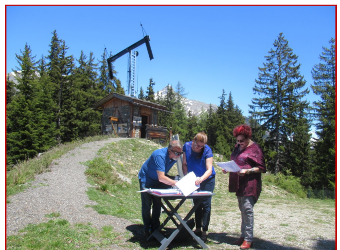
Tour de Saint-André.

a redessiné les plans des mécanismes des télégraphes Chappe, dessins qui ont servi de base à la reconstruction des télégraphes de Saint-André, de Sollières-Sardières et d'Avrieux. Avant de partir, le chercheur aura quand même pu apprendre que, pour la première fois depuis le XIX e siècle, des échanges de signaux entre plusieurs télégraphes Chappe ont de nouveau été possibles, prouesse réalisée en Maurienne.